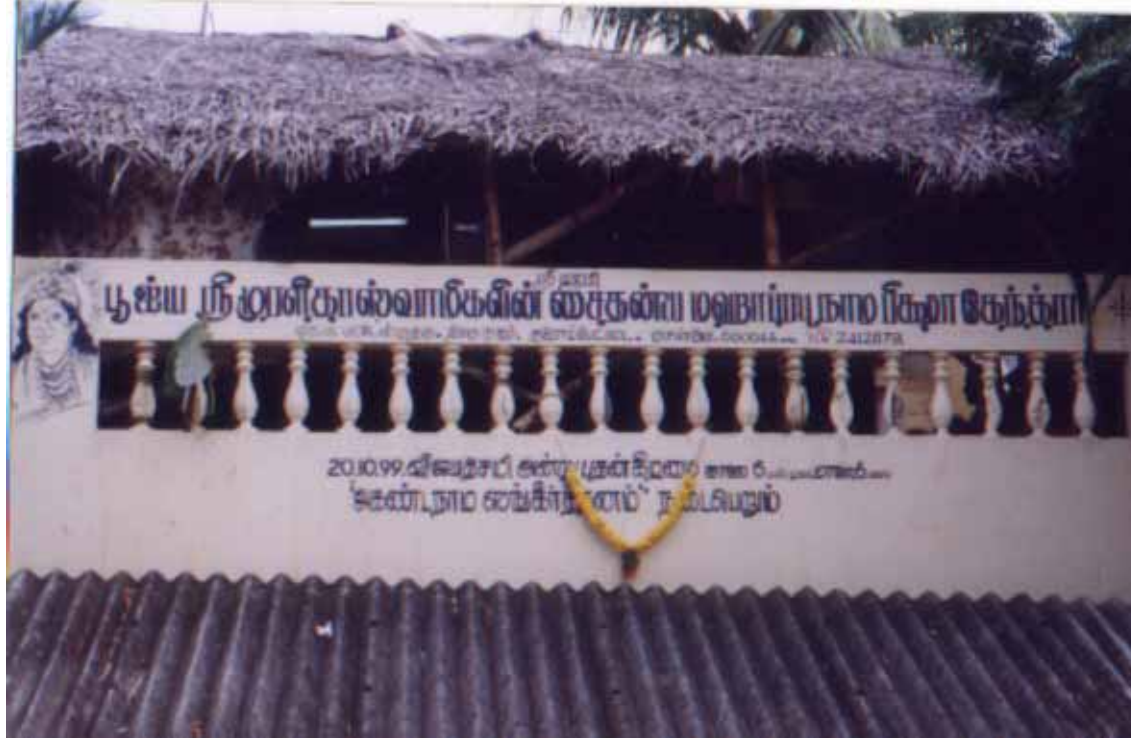
விஜயதசமி அன்று துவக்கப்பட்ட ஸ்வாமிகளின் சைதன்ய மஹாப்ரபு நாமபிக்ஷா கேந்த்ரா