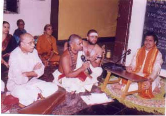
சென்னை ப்ரேமிகபவனத்தில் “த்வி ஸஹஸ்ரவதானி” நாகபணி அவர்களின் “அஷ்டாவதானம்” நிகழ்ச்சி