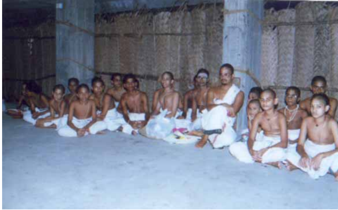
மதுரபுரி ஆஸ்ரமத்தில் வேத பாடசாலை வித்யார்த்திகளுடன் ஸ்ரீ ஸ்வாமிகள்