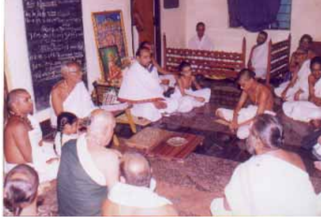
ஸமீபத்தில் சென்னை ப்ரேமிகபவனத்தில் நடைபெற்ற கல்வைத்த வாரம் நிகழ்ச்சி